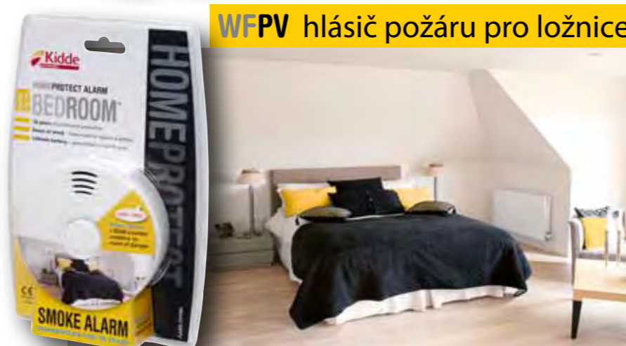
WFPV hlásič požáru pro ložnice