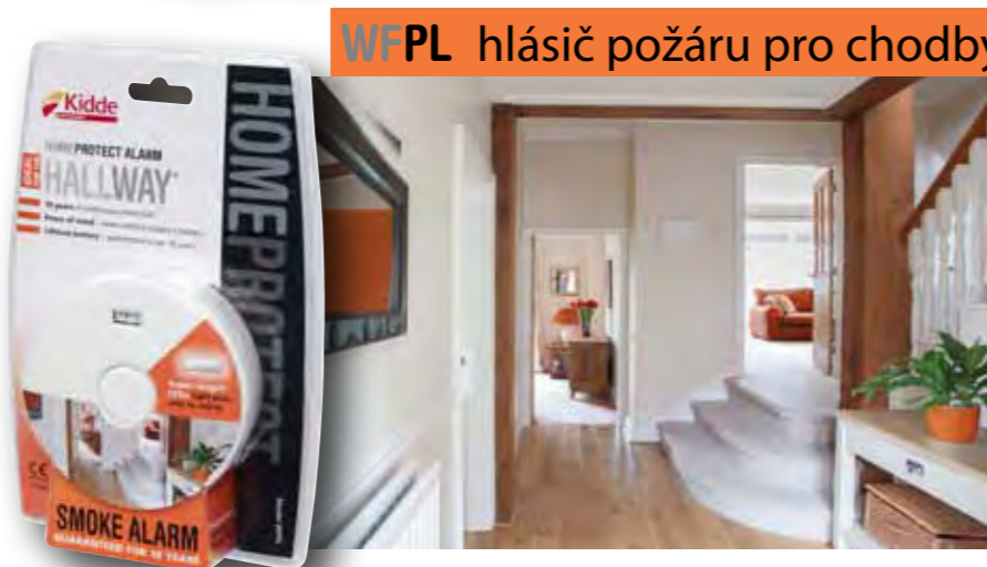
WFPL hlásič požáru pro chodby