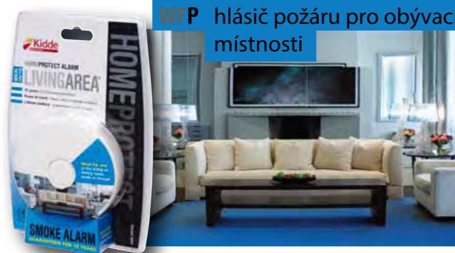
WFP hlásič požáru pro obývací místnosti