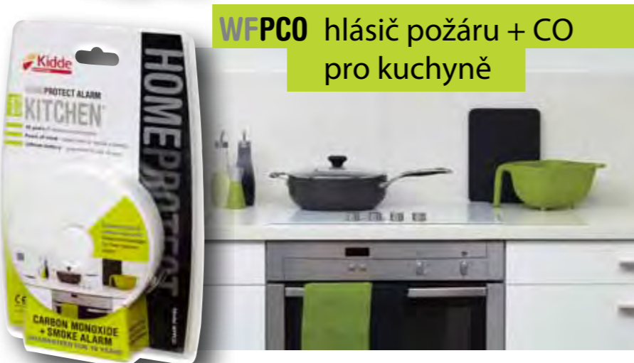
WFPCO hlásič požáru + CO pro kuchyně